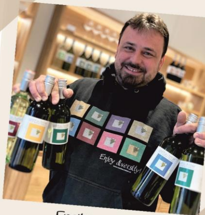
Freitags im Vineum

Wir lieben den persönlichen Kontakt zu unseren Kundinnen und Kunden und deshalb verkaufen wir einen großen Teil unserer Weine ab Hof. Im Vineum haben wir Zeit, um mit euch über unsere Weine zu plaudern und sie miteinander zu verkosten.